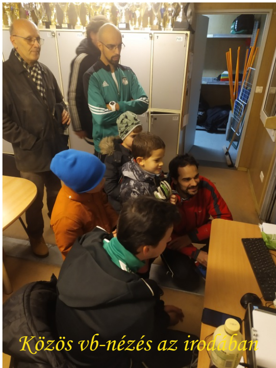
Közös vb-nézés az irodában