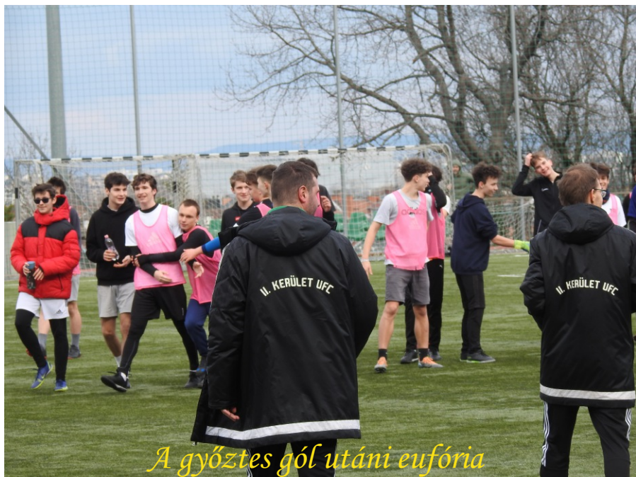
A győztes gól utáni eufória