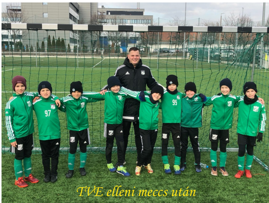
TVE elleni meccs után

A 2014-es gyerekek a hónapban először 10-én léptek pályára a Kalap utcában, a III.ker TVE vendégeként. Ellenfelünkkel nem először találkoztunk, viszonylag gyakran szoktuk összemérni az erőnket, hiszen mindig nagyon jó, pörgős és izgalmas mérkőzéseket játszunk. Már nem először fordult elő hogy a megszokottól eltérően 7:7 ellen játszottunk, ami most is jól sült el! Legutóbb amikor így gyakoroltunk, nekünk jött ki jobban a lépés, mi tudtunk több helyzetet kialakítani, viszont most inkább ellenfelünk akarata érvényesült. Sok gól esett mind a két oldalt, ügyesek voltak a gyerekek! A mérkőzés végén ellenfelünk megérdemelten nyert! Köszönjük a TVE-nek a vendéglátást, egészen biztos, hogy nem sokára újra találkozunk!