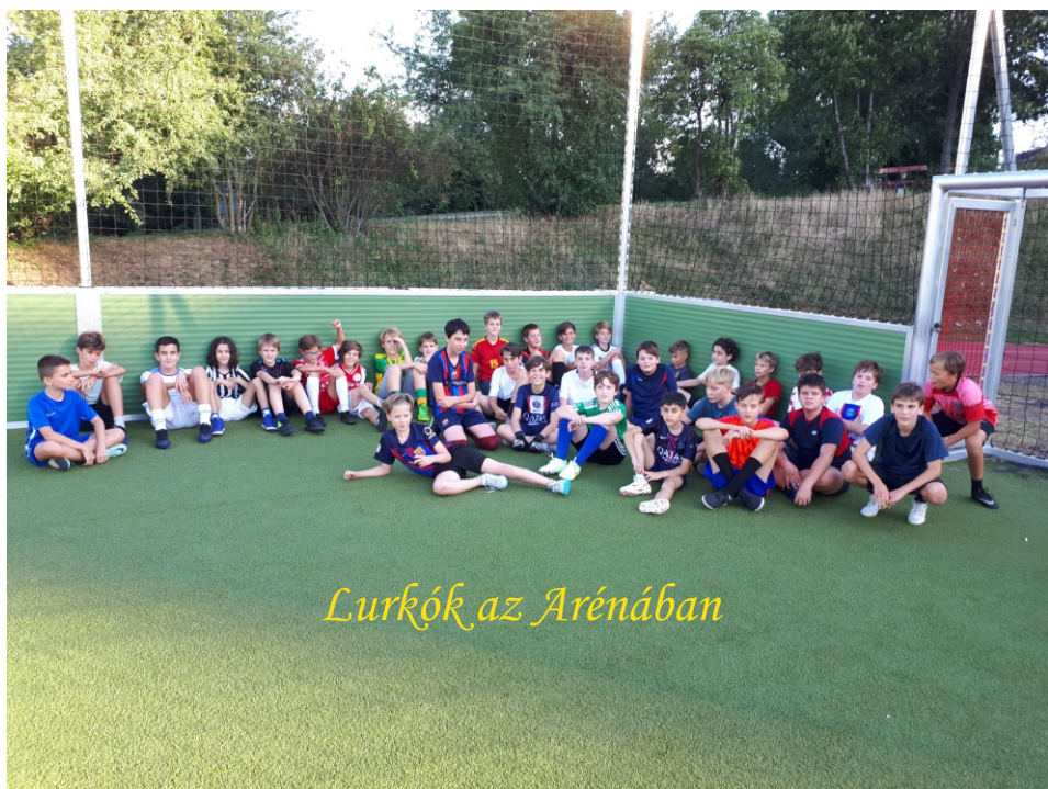
Lurkók az Arénában