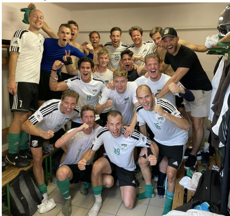
A Gázgyárt 2-0-ra vertük idegenben, ami az első győzelmünket jelentette a BLSZ I-ben.