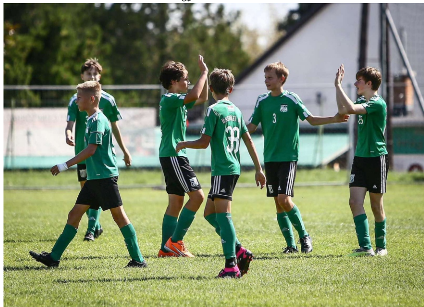
U15 BLSZ-bajnokság – gólöröm egy igazi rangadón a Kastélydomb SE elleni 4–3-as győzelem után!