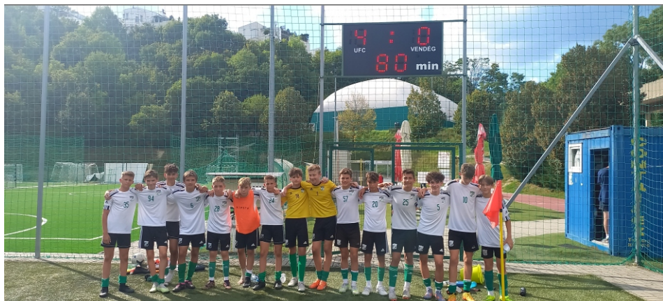
U15 MLSZ Regionális kiemelt bajnokság első mérkőzése a Nagykanizsa ellen és óriási siker 4-0.