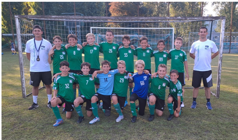
Első csapatunk 7–0-s győzelemmel kezdett idegenben.