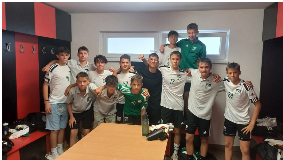
U15 MLSZ Regionális kiemelt bajnokság – Budafok ellen 2-2 pontmentés az utolsó percekben!