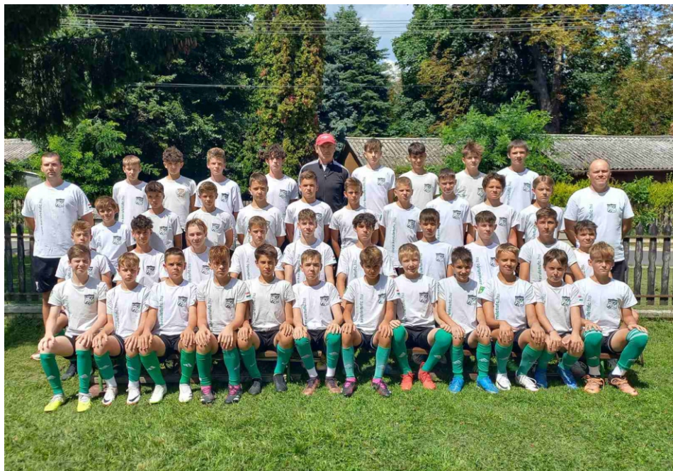
A nagybetűs CSAPAT.