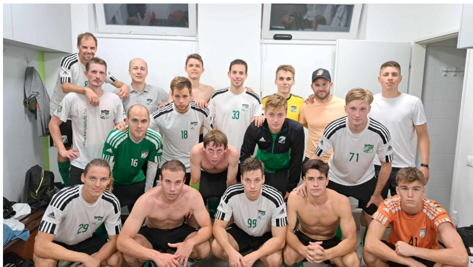
A Csepel UFC otthonában bemutatkoztunk a BLSZ I-ben.