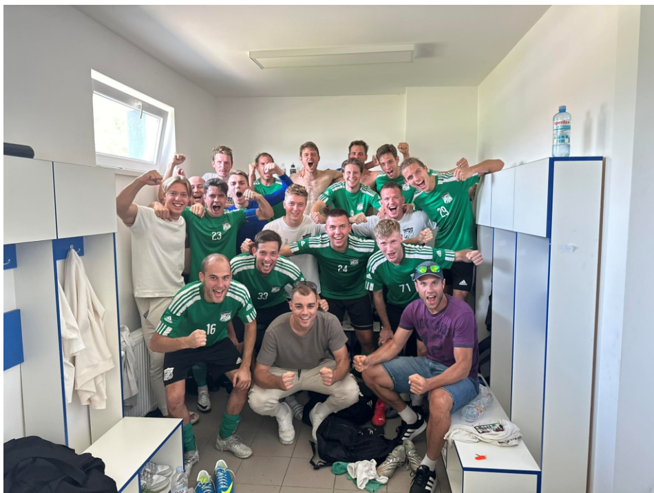
Volt minek örülni az Issimo elleni 4–1-es győzelem után.