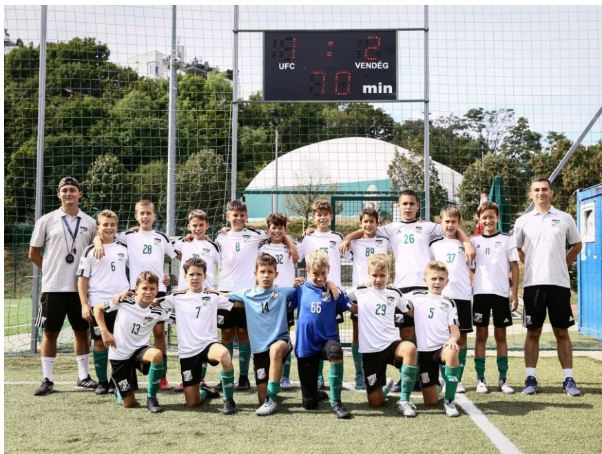
Az év eddigi legjobb meccsét játszottuk a Barca ellen (1–2).