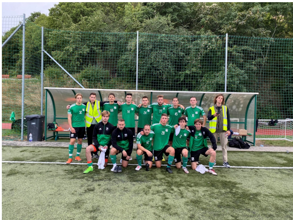
A Nagytéténytől ugyan kikaptunk 3–0-ra, de a srácok szépen helyálltak,