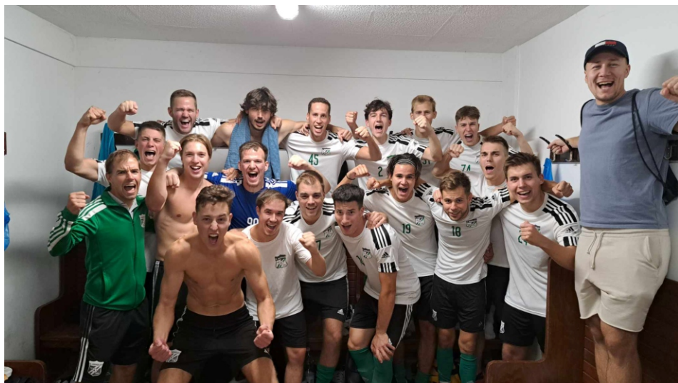
A BLSZ II nyitányán nagyszerű második féldővel 3–1-re vertük az Airmergyt.